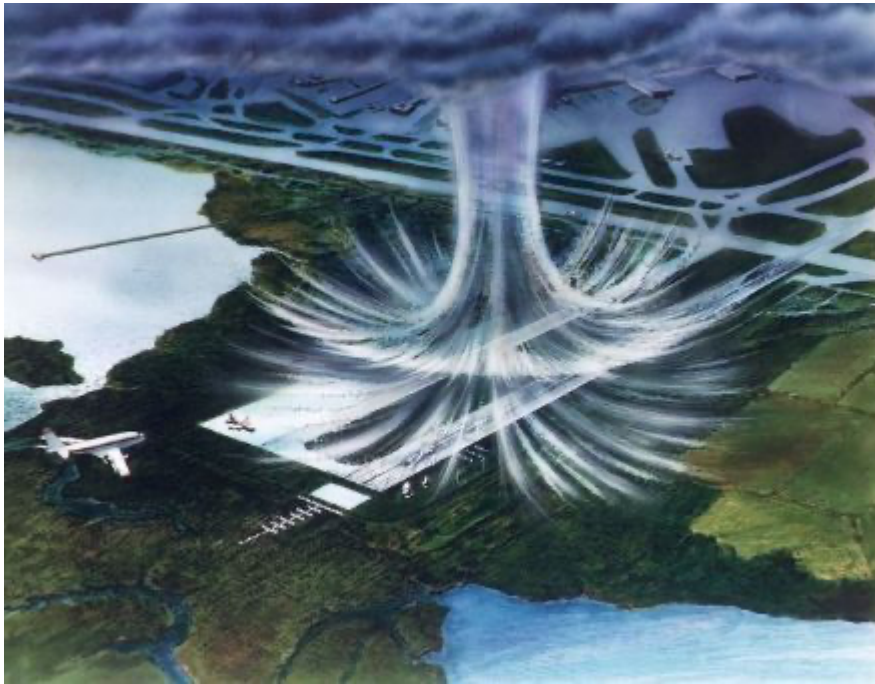
Abb. 1: Die Abbildung zeigt eine schematische Darstellung eines Downbursts. Dabei ist die Fallböe ersichtlich (Bildmitte), die sich bei Kontakt zum Boden in alle Richtungen ausbreitet, wobei grosse Windgeschwindigkeiten erreicht werden können.

Bei kräftigen Gewittern können auch mehrere Downbursts auftreten, wodurch in Zugrichtung des Gewitters wiederholt Schäden auftreten können.